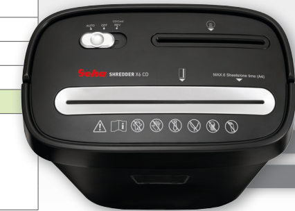
Papier- und CD/DVD-Shredder Partikelschnitt