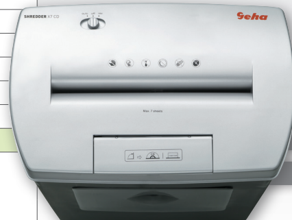
Unser TOP-Seller für die Anwendung zu Hause! Papier- und CD/DVD-Shredder Partikelschnitt