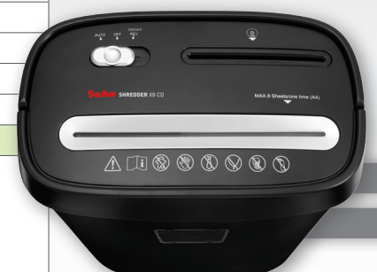
Papier- und CD/DVD-Shredder Partikelschnitt