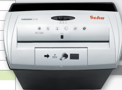
Papier- und CD/DVD-Shredder Streifenschnitt